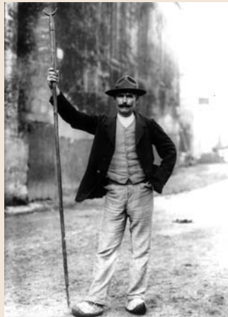
Archives Iconographiques du Palais du Roure - Avignon